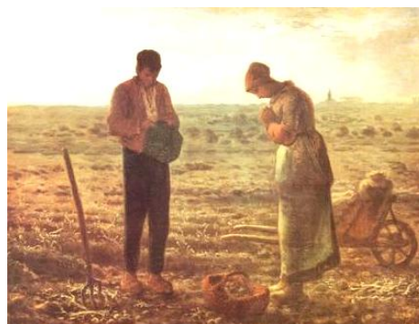
Onderbreking van de arbeid met Angelusgebed

Dan ken ik als priester de gebeden in de Eucharistie en vooral het Eucharistisch gebed. Dat is iedere keer een ontmoeting met God en de ene keer meer ervaarbaar dan de andere keer. Er is dan een serene sfeer in de kapel, samen met de aanwezige gelovigen. Het is vaak heel intens en geeft troost en kracht om het leven weer beter aan te kunnen.