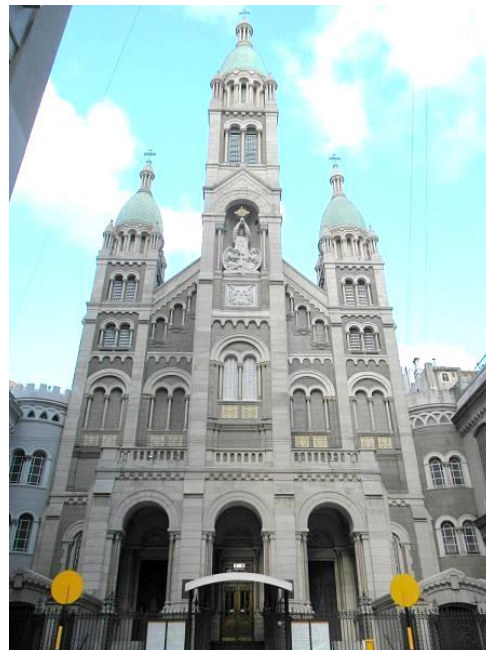
Basiliek van het Heilige Sacrament in Buenos Aires

Destijds vertelde de paus ook dat hij altijd een stoffen zakje bij zich draagt met een kruisje dat ooit was bevestigd aan de rozenkrans waarmee pater Aristi werd begraven; telkens wanneer een onbarmhartige gedachte bij hem opkomt, raakt hij het even zakje aan. 'Ik voel de genade! Ik voel de weldaad ervan. Wat doet het voorbeeld van een barmhartige priester goed, [het voorbeeld] van een priester die dicht bij de wonden komt.'